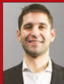
Por Mariano Eiben

L a playa de El Tarajal, en Ceuta (comunidad autónoma española en el norte africano) se ha convertido en los últimos días en un escenario de desesperación humana y política, donde la vida pende de un hilo y también de la marea.