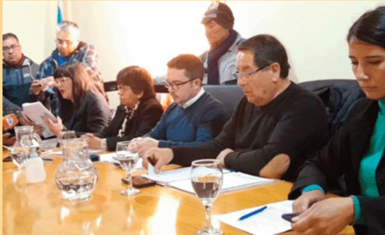
El proyecto fue aprobado por todos los concejales jachalleros.

El tema venía generando preocupación en un sector de la comunidad jachallera desde hace tiempo con el argumento de que la Cuenca Hídrica Pampa del Chañar, es la que abastece de agua potable a Jáchal. Y por eso se pretendía establecer el cui-