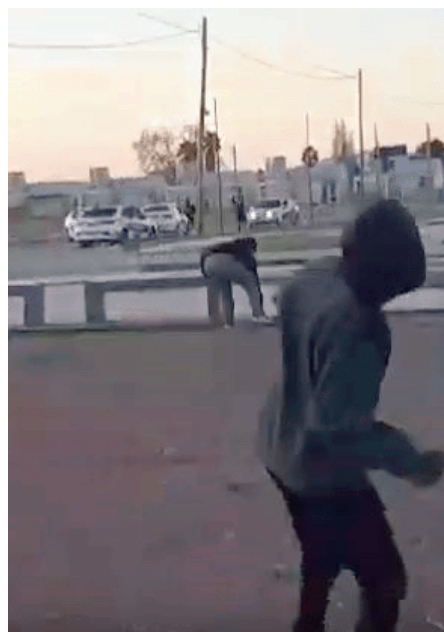
El ataque en el Barrio Las Pampas el domingo pasado fue uno de los últimos incidentes de agresiones a la fuerza.