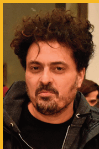
Ariel Sampaolesi: actor