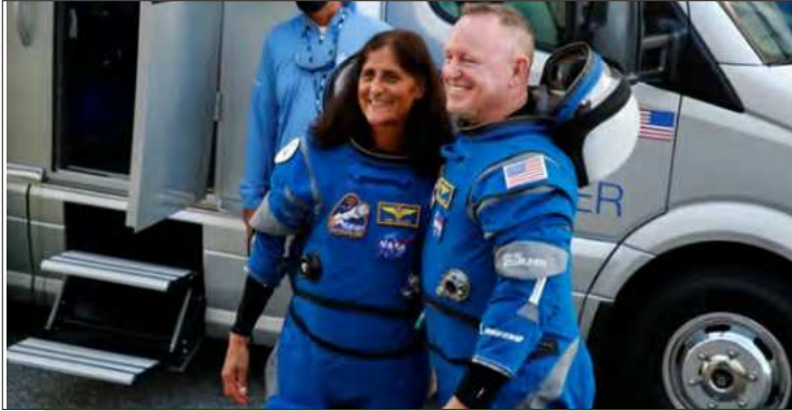
Los astronautas Butch Wilmore y Suni Williams