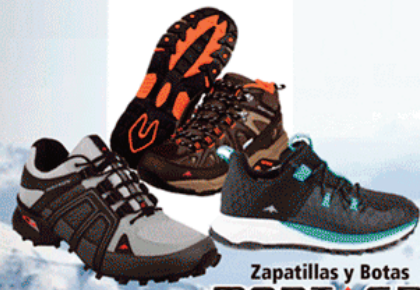
Zapatillas y Botas MONTAGNE

ABRIGOS Y CAMPERAS PANTALONES - CALZADO CAMPING - MOCHILAS INDUMENTARIA OUTDOOR