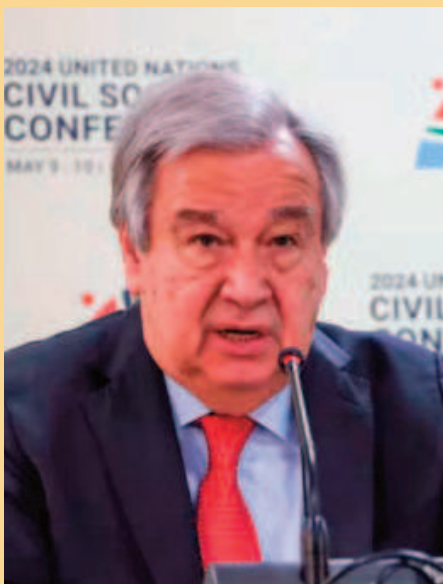
Secretario general de la ONU, António Guterres

El problema es que, pese al avance de las renovables, las emisiones mundiales no acaban de caer lo rá-