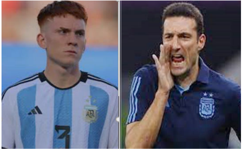
Valentín Barco y Lionel Scaloni.

Hay que tener en cuenta que tras estos dos encuentros, Argentina jugará dos duelos preparatorios más antes de dar el primer paso en la Copa América de Estados Unidos. El domingo 9 de junio jugará ante Ecuador . Acto seguido, el viernes 14 se enfrentará