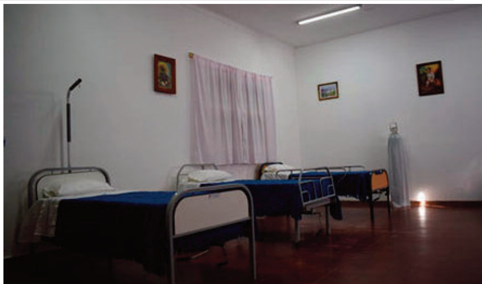
Un convenio con el Pami les permitirá mejorar los servicios y contratar más profesionales.

Actualmente la residencia tiene 165 internados y una lista de espera de