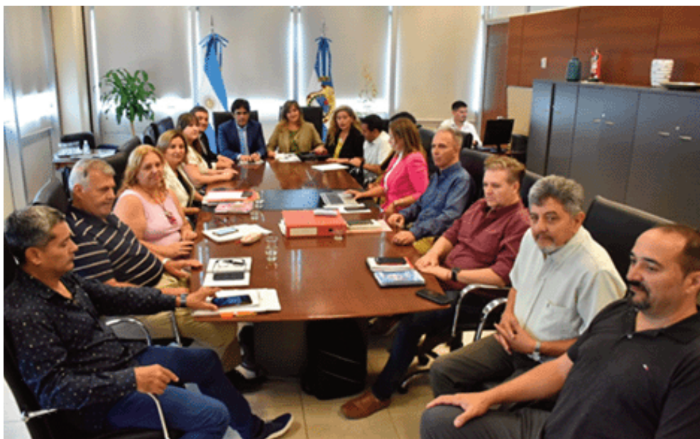
Los gremios docentes de la provincia rechazaron la oferta salarial del Gobierno en el encuentro del jueves.

Hay que recordar que el paro nacional por 24 horas para el lunes fue convocado por los gremios docentes nucleados en la Confederación General del Trabajo (CGT). La medida fue dispuesta luego de que el Ejecutivo nacional no fijara un piso salarial durante el encuentro que tuvieron el martes.