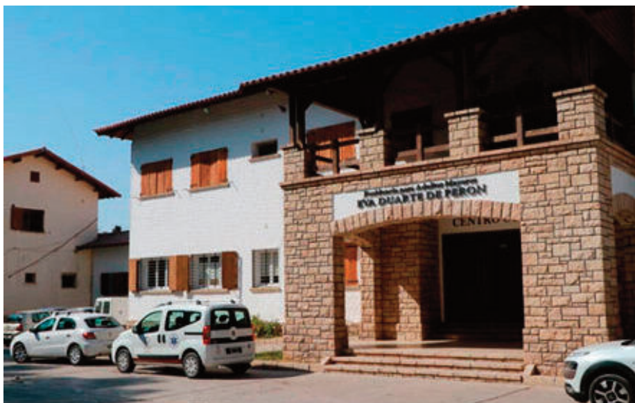
La Residencia Eva Duarte está en Rivadavia y ahora tiene 165 internados.

El costo mensual parte desde los 250.000 pesos y puede llegar a los 800.000 pesos, en algunos casos de los encuadrados en una categoría superior.