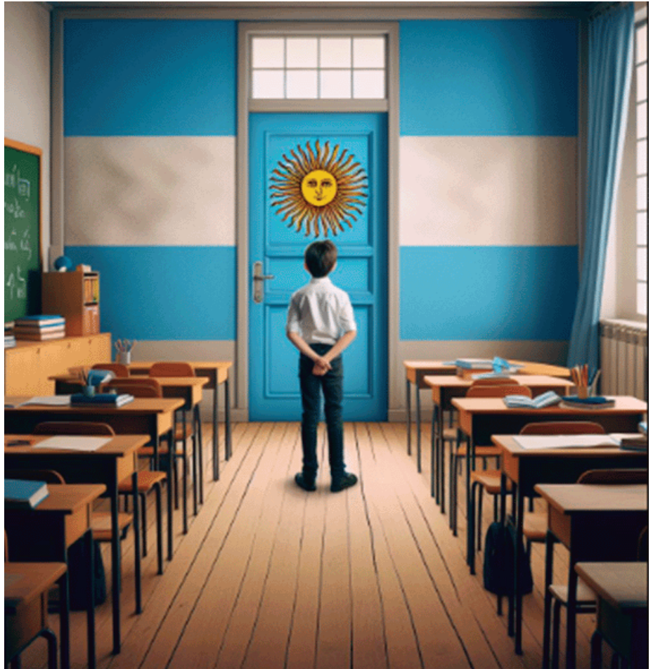
Imágenes creadas con Inteligencia artificial

adhesión al paro convocado por CGT para el 4 de marzo debido a que, "desde Nación, no se están cumpliendo ni respetando las leyes laborales, se atenta contra la paritaria (...) y contra los derechos de los trabajadores en general y docentes en particular".