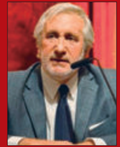
Por Julio Conte-Grand*

E l perfil institucional de la Ciudad de Buenos Aires responde esencialmente a la configuración determinada en la Constitución de 1994, la ley 24.588, normas concordantes y la riqueza de los antecedentes históricos.