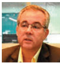
Por Claudio Leiva

E n San Juan funcionan unos 90 geriátricos, pero sólo poco más de 30 están legalmente registrados, mientras que el resto trabajan con autorizaciones transitorias y en forma irregular, según afirman fuentes del sector. La situación genera temor porque hay antecedentes de casos en los que los internados sufrieron algún tipo de complicación que determinó su muerte, en los que los familiares no pudieron conocer con precisión qué es lo que pasó.