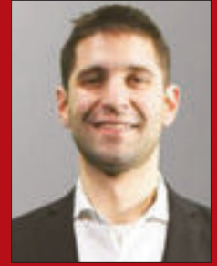
Por Mariano Eiben

T ras dos días y dos noches de intensas negociaciones para salvar las últimas diferencias, la Unión Europea ha logrado un acuerdo sobre el pacto de migración y asilo con el que pretenderá gestionar previsible y ordenadamente el flujo de inmigrantes a su territorio. Las primeras conversaciones iniciaron en el ya lejano año 2020 a petición de la Comisión Europea.