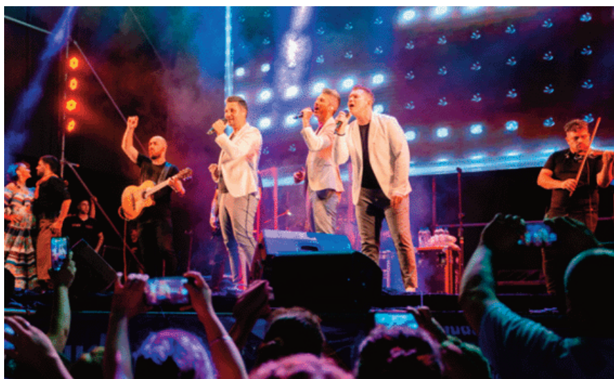
La actuación de Destino San Javier.