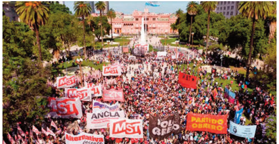
Si bien se la denominó marcha piquetera lo cierto es que las columnas más importantes la aportaron partidos de izquierda que lucieron los carteles más grandes

El mayor interrogante era saber cómo iba a actuar la Policía Federal con Gendarmería y hasta dónde iban a llegar los piqueteros en sus reclamos. Más allá de agresiones menores, las diferentes columnas llegaron a Plaza de Mayo, donde después de las 17 se leyó un documento, y comenzó la dispersión. En síntesis, un gran despliegue que tuvo como resultado las previsibles dificultades para circular por parte de los ciudadanos.