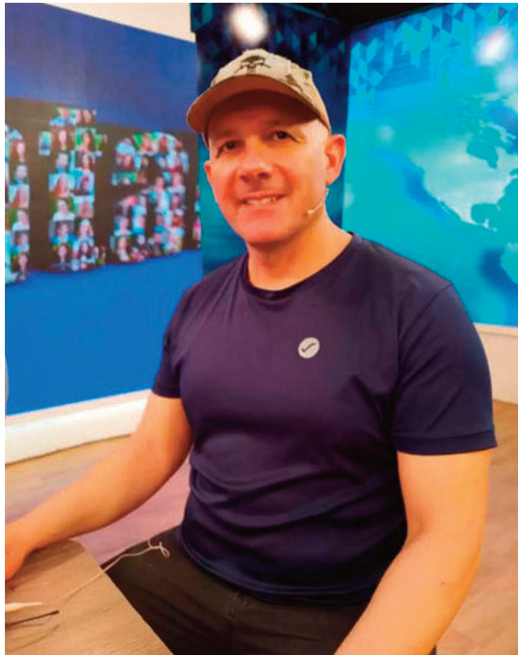
Ferreri se quejó por la explotación laboral que genera el alquiler de licencias de taxis y remises.

Entre ellos se encuentran que los remiseros y taxistas tengan la opción de