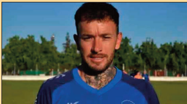
Ben Hur y Estudiantes de San Luis. En total jugó 192 partidos y convirtió 33 goles en 5 categorías de Argentina por las que pasó.

Se trata de un delantero proveniente de Güemes de Santiago del Estero. En ese club el futbolista disputó 34 partidos, anotó 4 goles y dio 8 asistencias. Casa, también jugó en Atlético Rafaela, Chacarita, Central Norte, J.J. Urquiza,