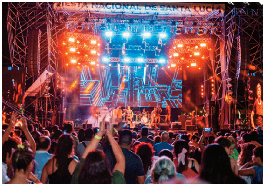
El imponente escenario montado en la plaza.