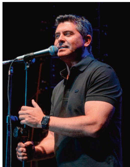
El gobernador Marcelo Orrego habló el domingo durante la fiesta.