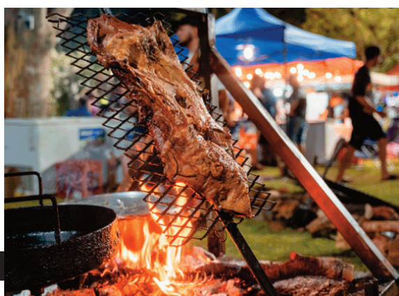
La gastronomía no estuvo ausente.