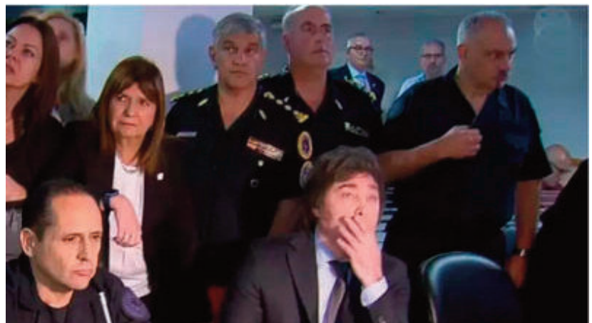
Javier Milei supervisó el operativo antipiquete junto a Patricia Bullrich en el Centro de Operaciones de la Policía Federal, mientras que las columnas de manifestantes de organizaciones sociales y de izquierda llegaban a la Plaza de Mayo, en medio de algunos disturbios.