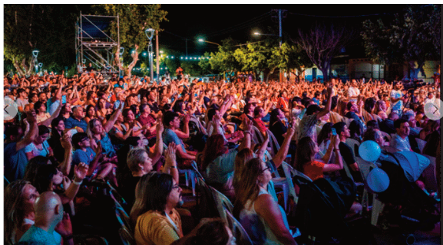
Una multitud cubrió cada rincón de la plaza.