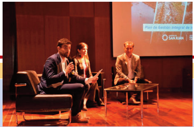
La presentación se hizo durante la mañana en la Sala Auditorio del Museo de Bellas Artes Franklin Rawson.