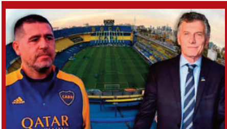
A PEDIDO DE IBARRA Y MACRI

LA JUSTICIA ORDENÓ SUSPENDER LAS ELECCIONES EN BOCA