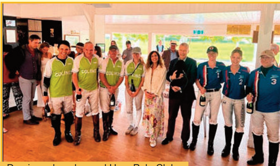
Domingo de polo en el Ham Polo Club.