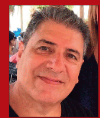
Por Daniel Manrique

Título original: True Lies Género: Acción | Comedia Origen: EE.UU. | 2023 Duración: 13 episodios de 45 minutos