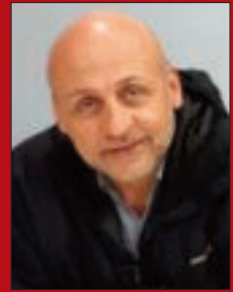
Por José Domingo Petracchini

S i se hiciera una encuesta y se le solicitara a la gente que mencionara tres instrumentos musicales, no tengo duda que el mayor porcentaje contestaría guitarra, piano y violín. Esta respuesta de ninguna manera significa que estos instrumentos sean superiores al resto, sino que son los más populares para el común de la gente que no está muy cercana a la música o no lo está en forma permanente.