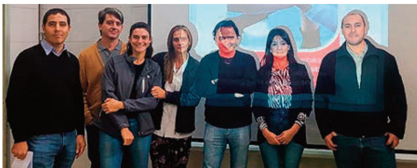
Equipo de Salud Pública a cargo de los programas contra la lepra

La intención es que se puedan regar cultivos que no tengan llegada directa a la mesa, como la lechuga o el tomate, sino otros que puedan tener usos industriales o para un destino forestal o forrajes para alimentar animales. Es el caso en particular de álamos, eucaliptus, pistachos, viñedos, alfalfa o maíz.