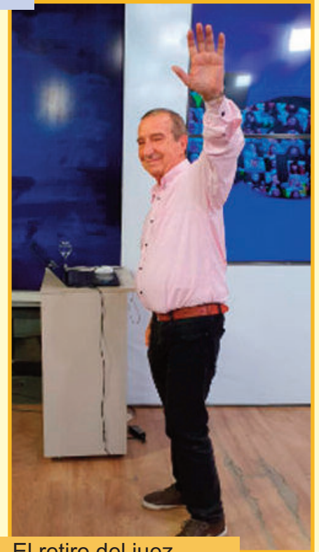
El retiro del juez

'gemelo' el Palacio Salvo, construido por el mismo arquitecto en Montevideo. En 1997 fue declarado Monumento Histórico Nacional. Incluye numerosas analogías y referencias a la Divina Comedia, del poeta Dante Alighieri. Fue pionero en el uso de hormigón armado dentro de un peculiar estilo ecléctico. En la cúspide posee un faro con 300 000 bujías.