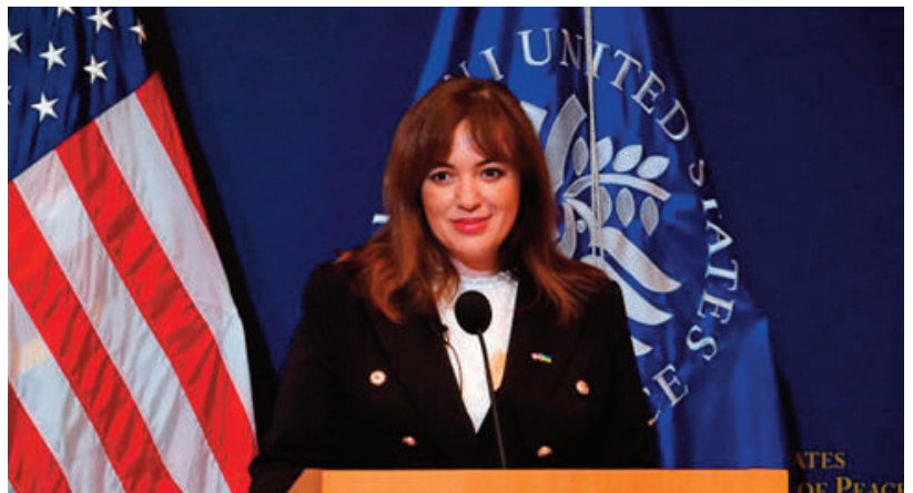
Lesia Zburanna, diputada de Parlamento ucraniano

La amplia investigación también encontró delitos cometidos contra ucranianos en territorio ruso, incluidos niños ucranianos deportados a quienes se les impidió reunirse con sus familias, un sistema de “filtración” destinado a señalar a Reino Unido .