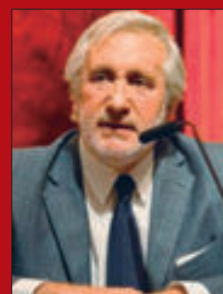
Por Julio Conte-Grand*

L a condición de esenciales o fundamentales de los derechos en el sistema del Estado Constitucional, implica la prevalencia de estos sobre toda norma anterior o sobrevinida, en la medida en que tales derechos constituyen un límite al ejercicio de las competencias, obligando a todos los poderes estatales, tal como lo establecen los artículos 41, 75 incisos 22 y 23, párrafo primero, de la Constitución Argentina.