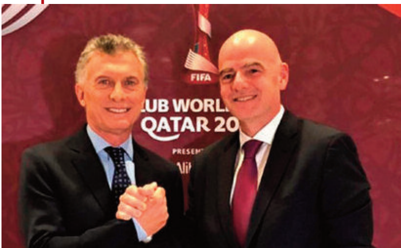
Macri con Gianni Infantino

E l jueves pasado fue reelegido sin oposición Gianni Infantino como presidente de la FIFA, el máximo organismo del fútbol mundial. El suizo de 52 años está en el cargo desde 2016, tras el escándalo con detenidos por denuncias de corrupción.