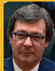
Rubén Uñac: senador nacional, abogado